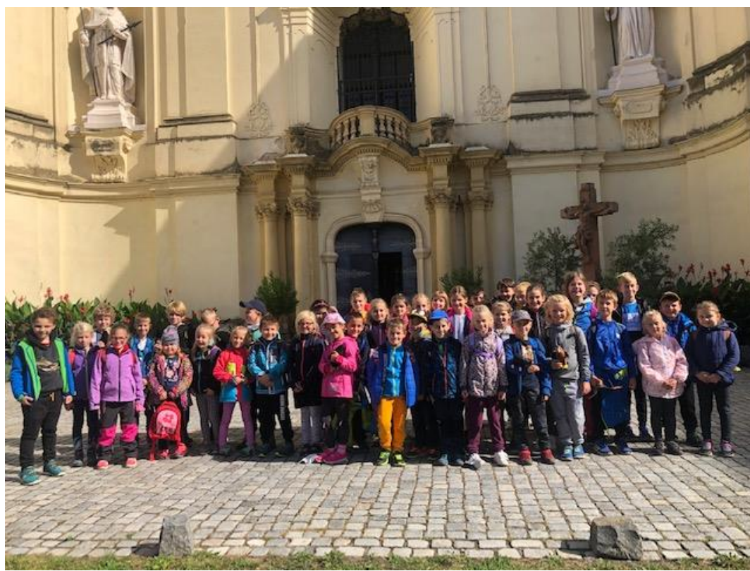
Želešice – entymologie I