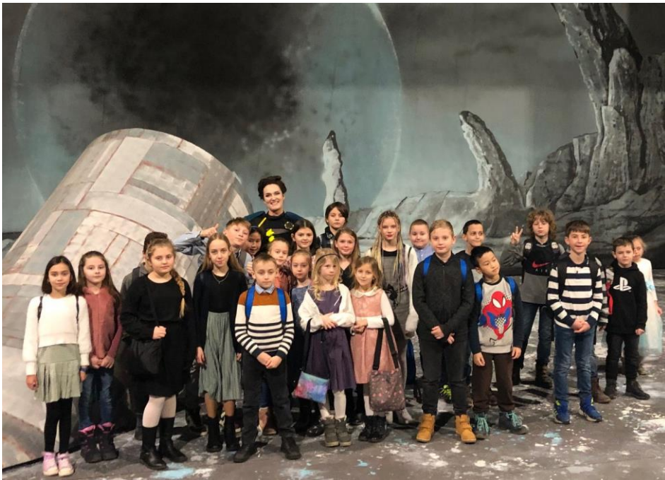
Janáčkovo divadlo – Kouzelná flétna