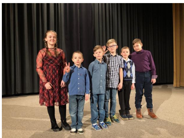
Recitační soutěž Dětská scéna v Ivančicích