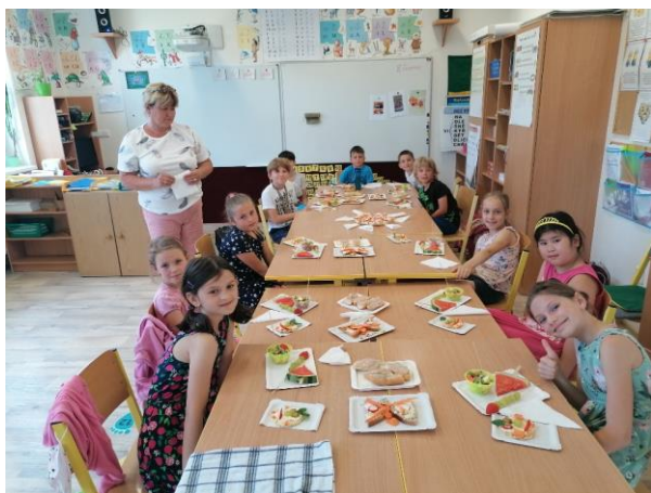
Projektový den „Zdravé svačiny“