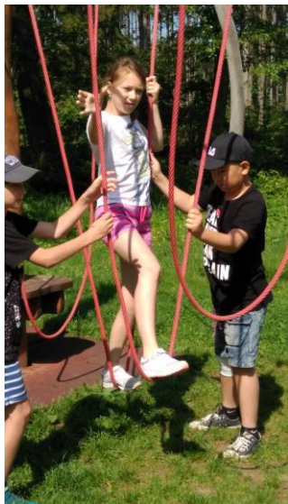
Akční výlet Březová