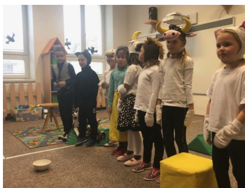
Prvňáci hrají divadlo pro školku