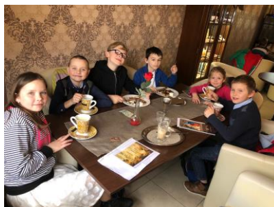
Odměna po recitační soutěži