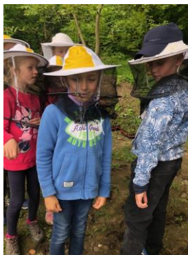
Včelí království – Otevřená