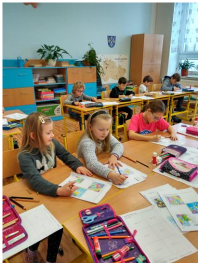
Škola v přírodě – zámek Telč