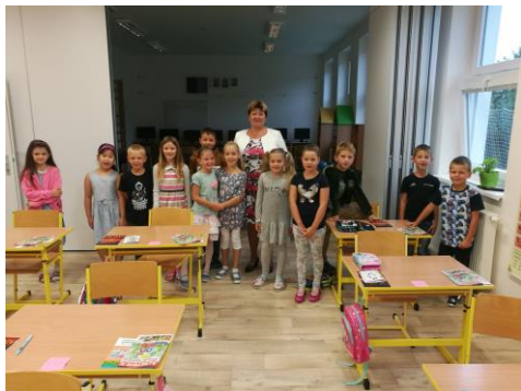
2 a 3.ročník