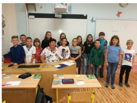
4. a 5.ročník