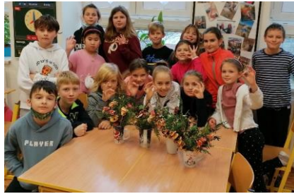
Prvníáci a Helloween