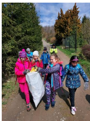
Den Země duben 2021